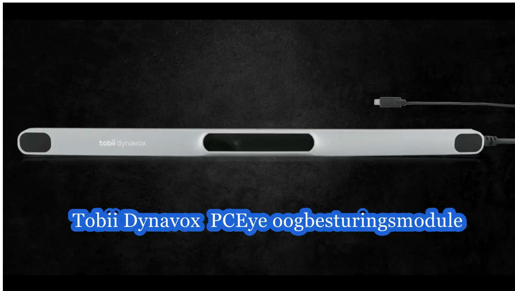
Tobii Dynavox PCEye oogbesturingsmodule